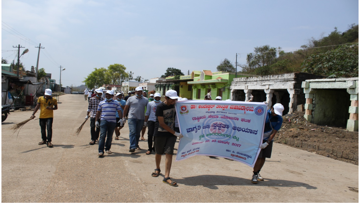
ಶಾ. ಅಂಜನೇಶ್ವರ ಕಾಲಕರ ಮಹಾವಿದ್ಯಾಲಯ ರಾಷ್ಟ್ರೀಯ ಸೇವಾ ಯೋಜನಾ ಘಟಕ ಜಾಗೃತಿ ಮತ್ತು ಸ್ವಚ್ಛತೆ ಅಭಿಯಾನ ಸ್ಥಳ: ಅಜೀರರಂಗನ ಬೆಟ್ಟ ದಿನಾಂಕ: 10 ಮಾರ್ಚ್ 2017