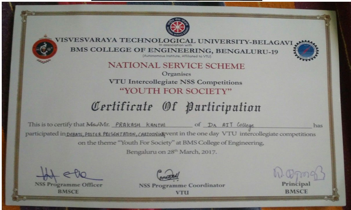
(Cartooning and Certification)