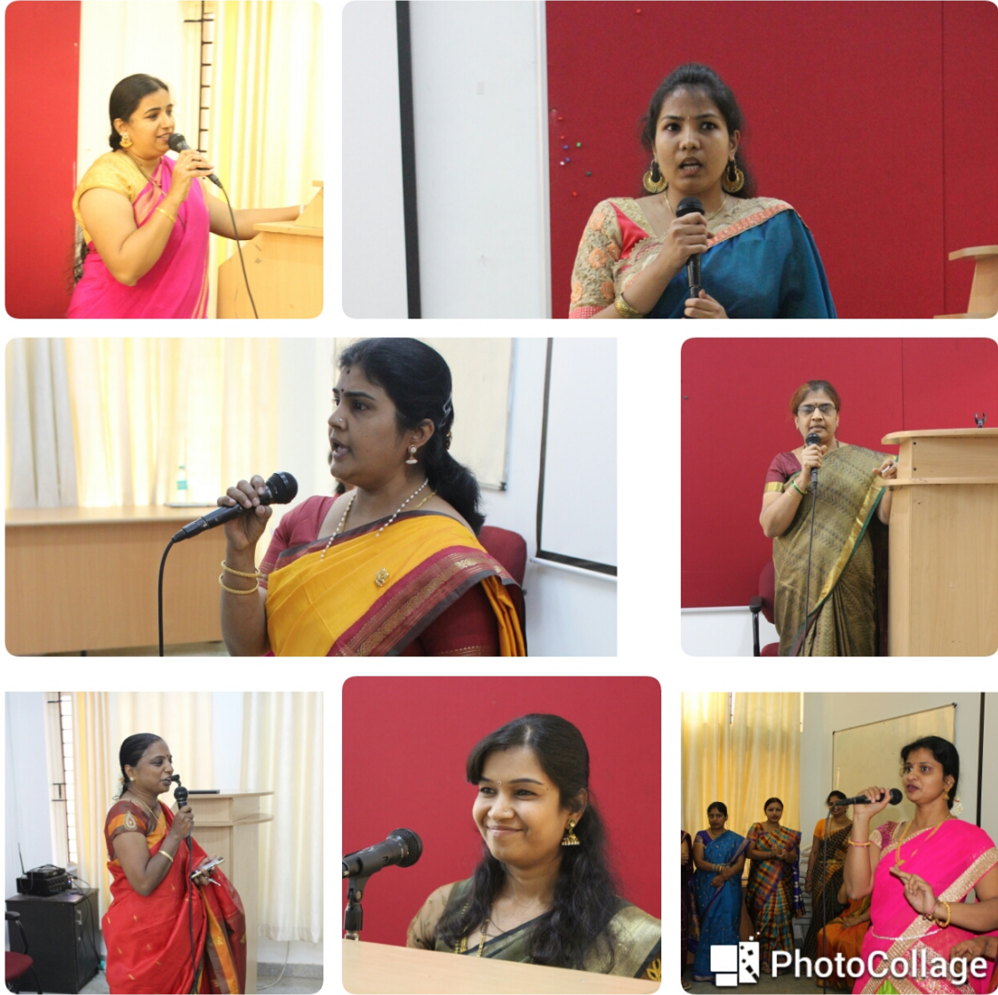
Singing Competition held on 04-03-2017