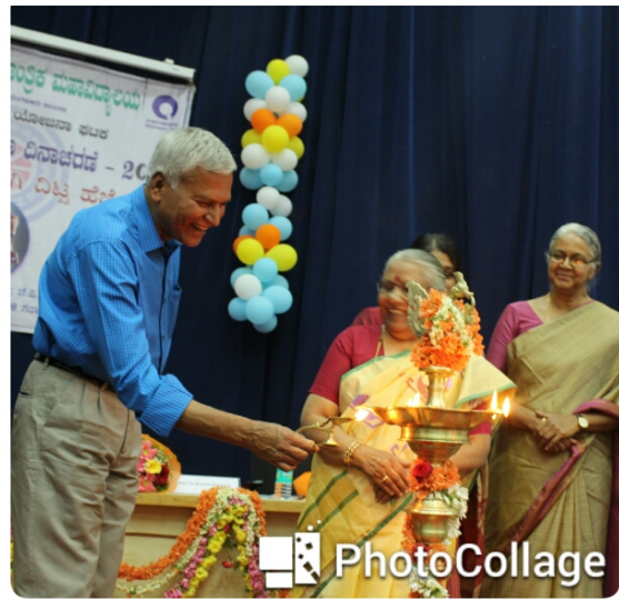
Lighting of Lamp by the Chief guests