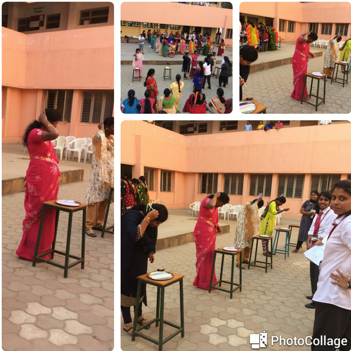
Super Minute competition held on 03-03-2017