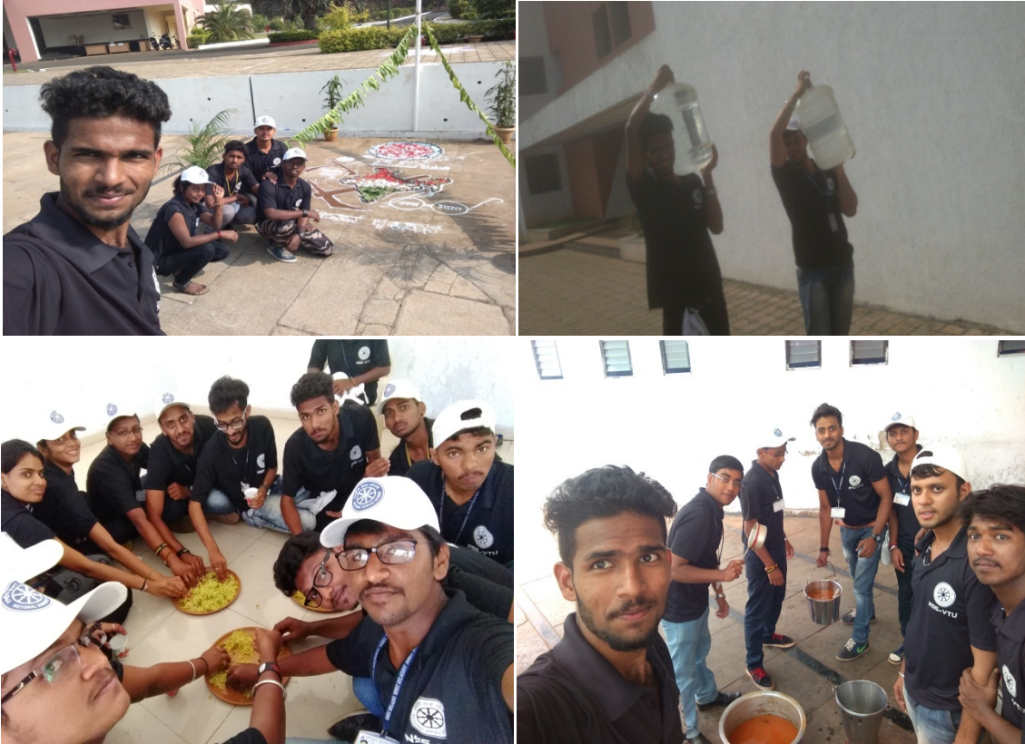
(Food Department organizers)

commander handed over the flag to group 3 who is hosting team for day 4. The day ended with cultural activities.