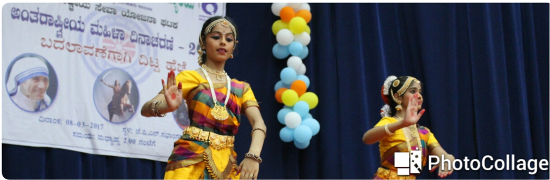
Cultural Programmes by the Students