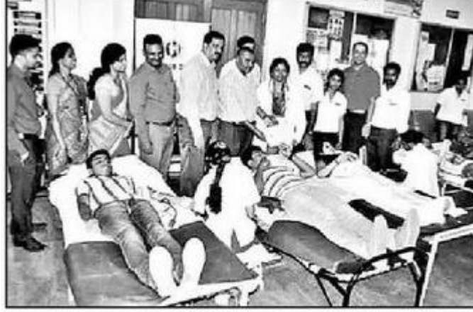
రక్తదానం చేస్తున్న విద్యార్థులు