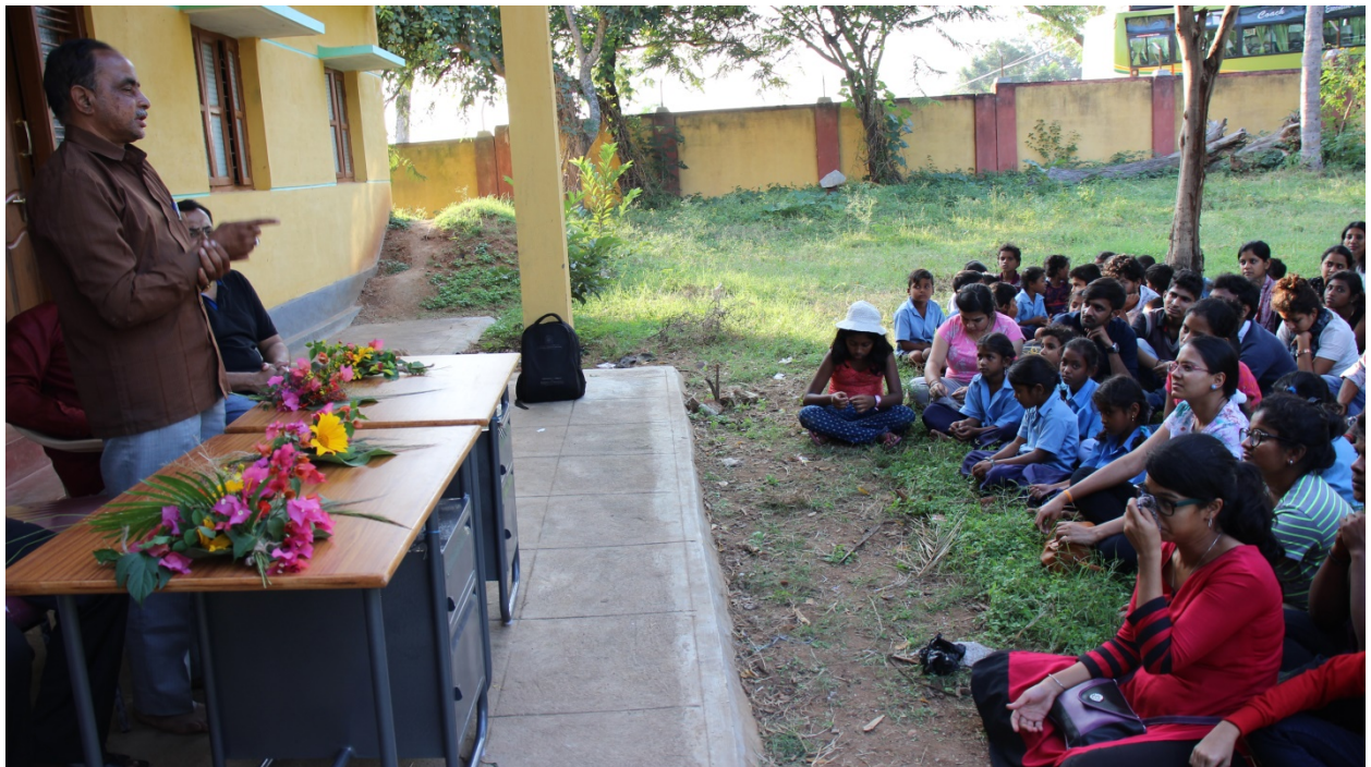
ವಿದ್ಯಾರ್ಥಿಗಳಿಗೆ ಮಾತನಾಡುತ್ತಿರುವ ಸಚಿವರು.