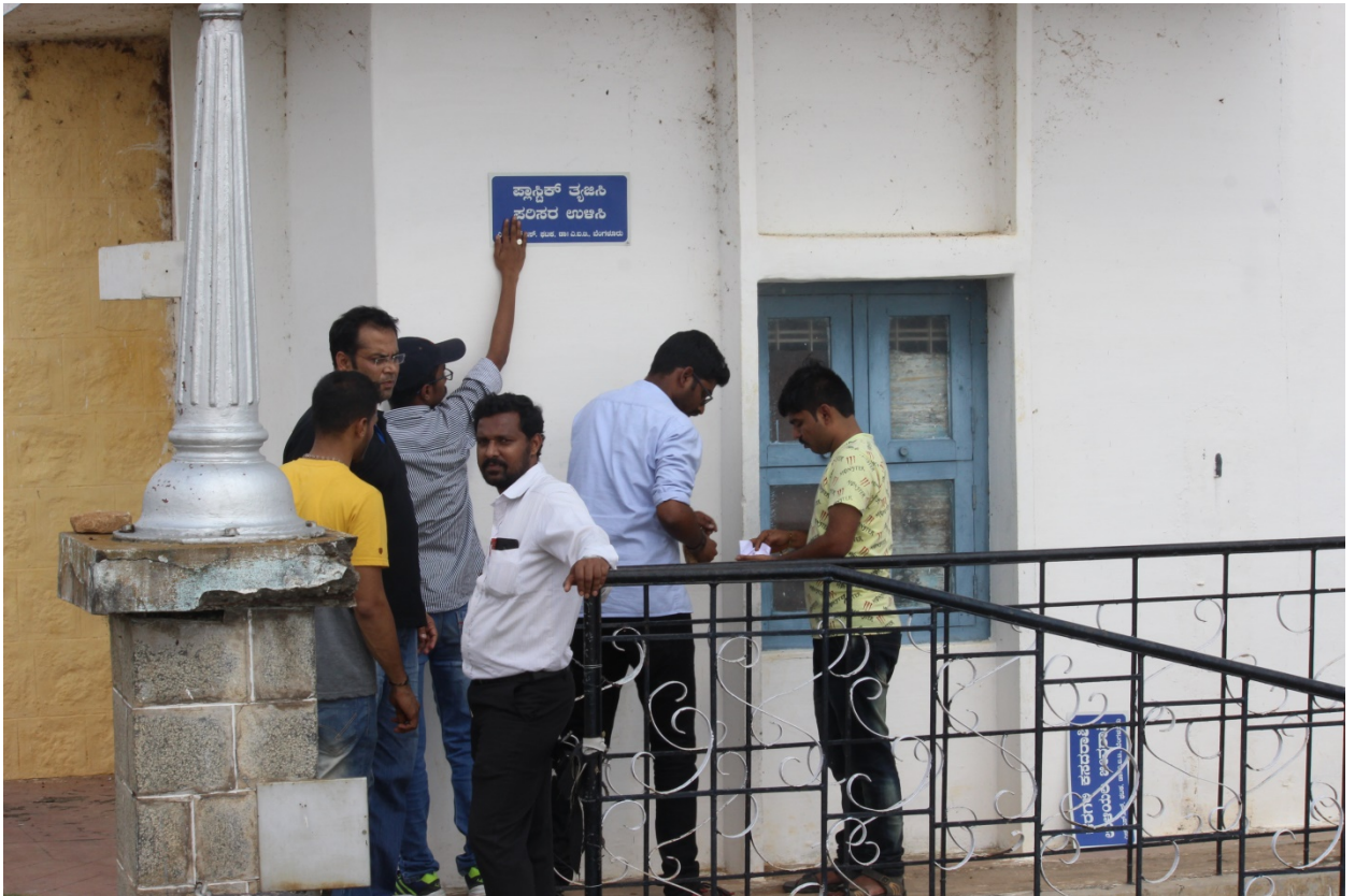
ಪ್ರತಿಭಾನ್ವಿತರನ್ನು ಸಂಪರ್ಕಿಸುವ ಕಾರ್ಯಕ್ರಮ