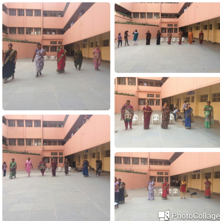
Lemon and Spoon competition held on 01-03-2017