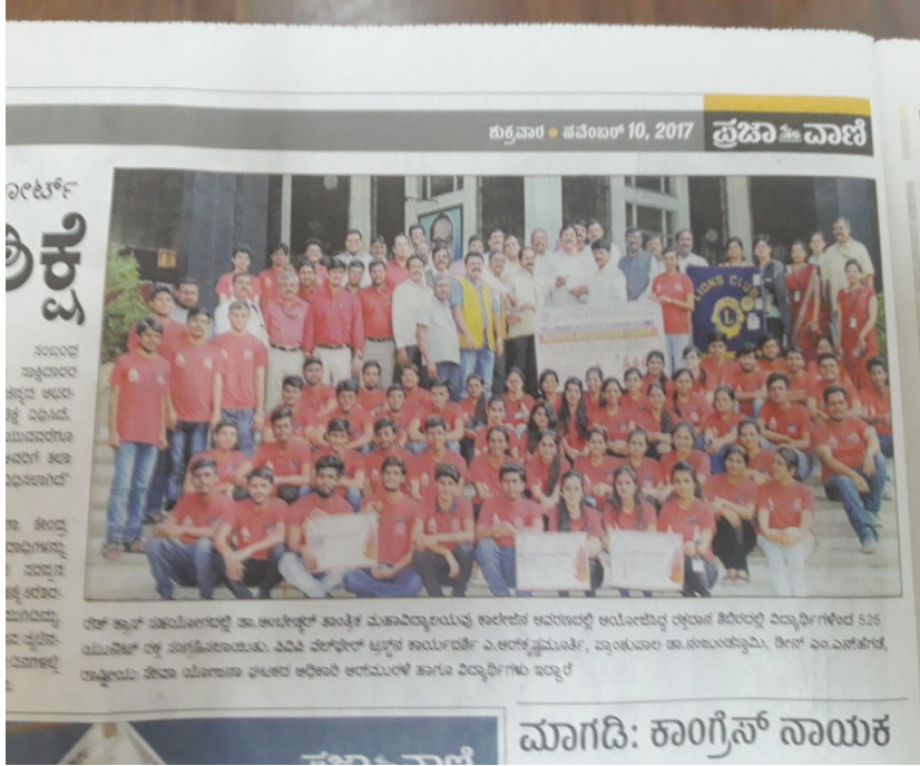
Prajavani news paper