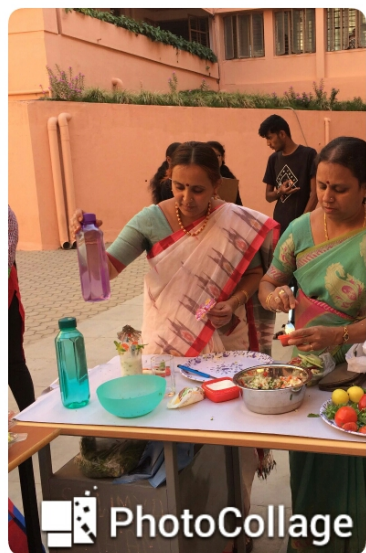
Cooking without fire competition held on 03- 03- 2017