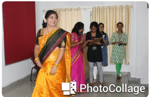
Ethnic Wear Competition held on 04-03-2017