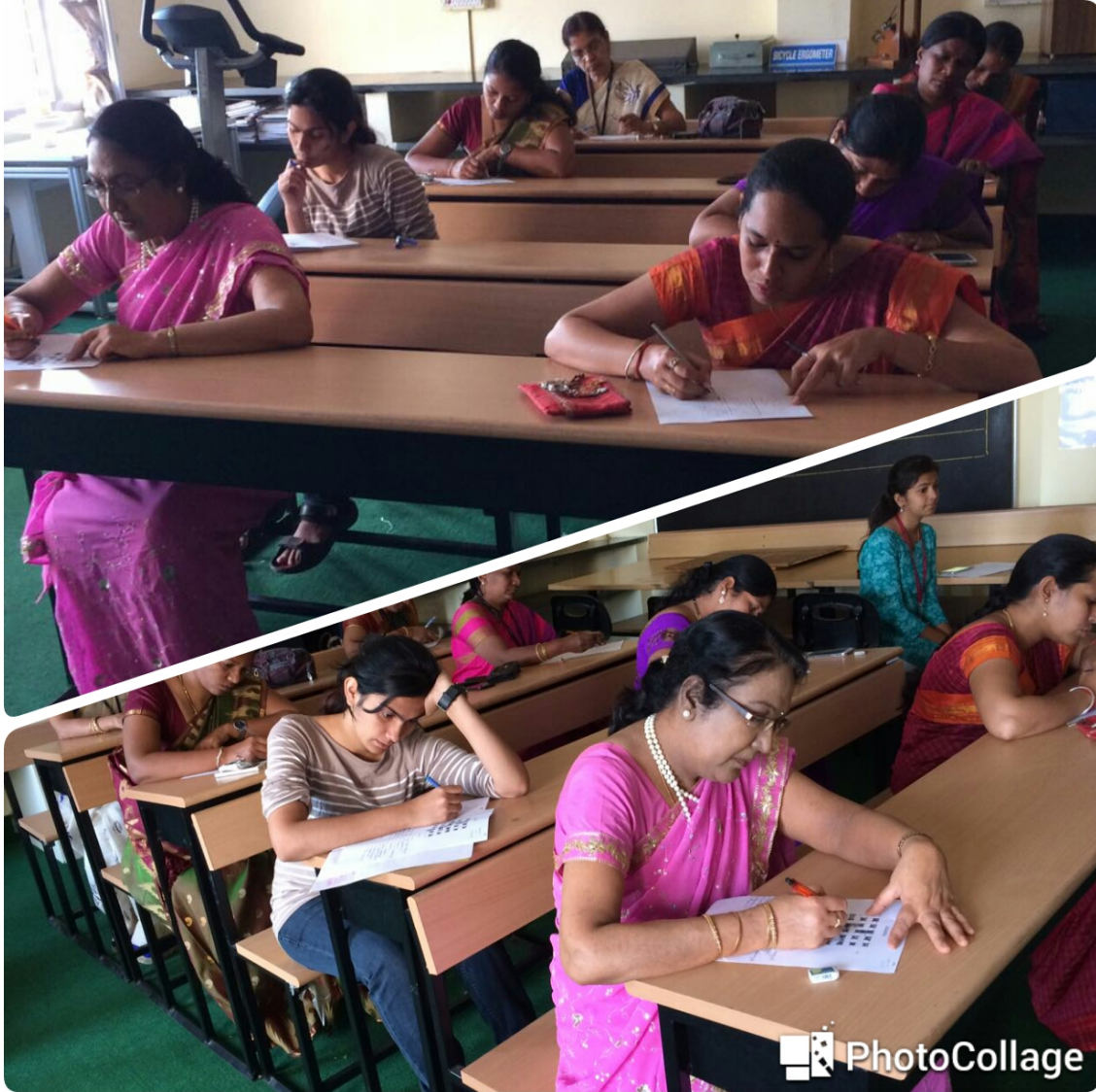
Cross Word Puzzle and Sudoku competition held on 02-03-2017