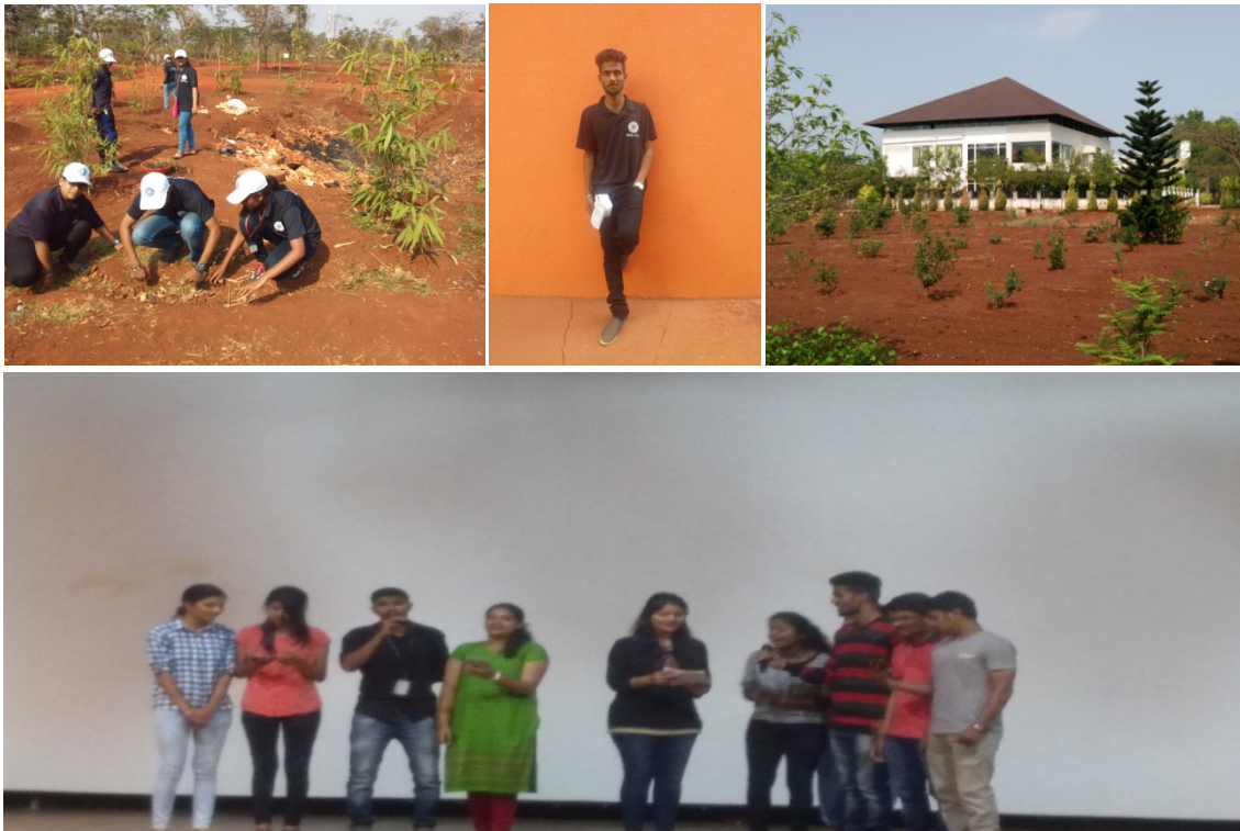
(Biodiversity and folk song)