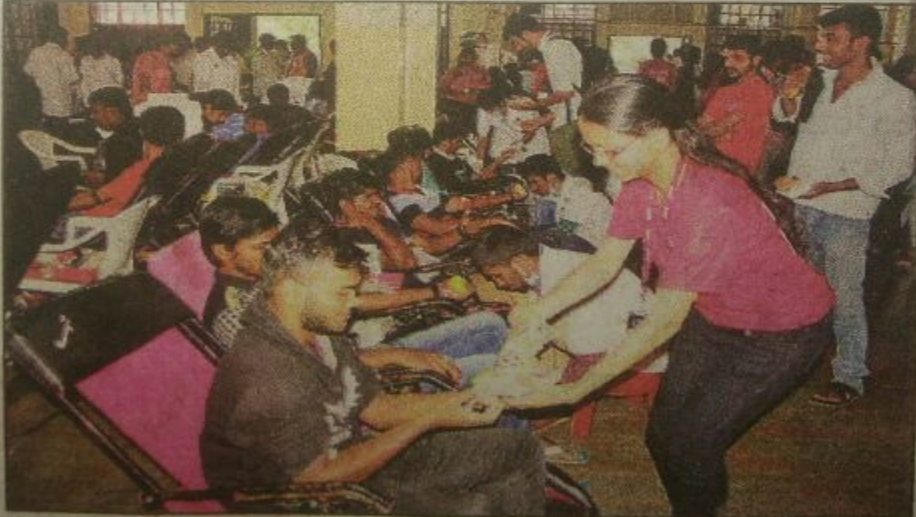
ಮಲ್ಲತ್ತಹಳ್ಳಿಯ ಡಾ. ಅಂಬೇಡ್ಕರ್ ತಾಂತ್ರಿಕ ವಿಶ್ವವಿದ್ಯಾಲಯ ಕಾಲೇಜು ಕ್ಯಾಂಪಸ್‌ನಲ್ಲಿ ರಕ್ತದಾನ ಶಿಬಿರ ನಡೆಯಿತು.