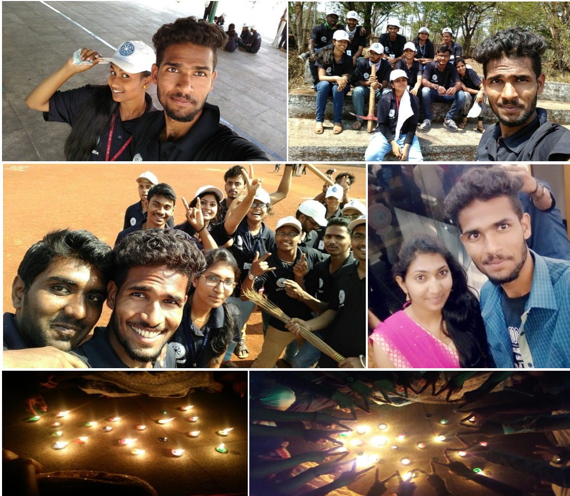
(VTU Ground Cleaning and emotional night)