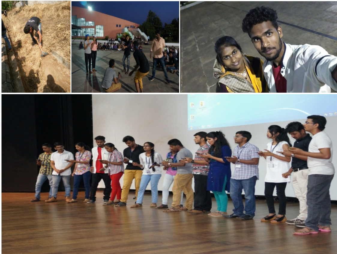
(VTU Campus cleaning, Street play and group folk song)