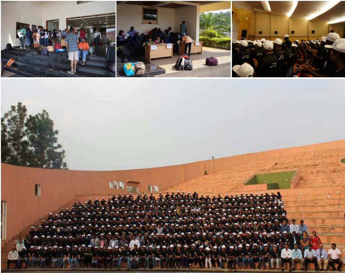
(Registration and T shirts Distribution)