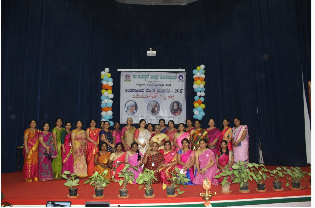
International Women's Day Organising Committee