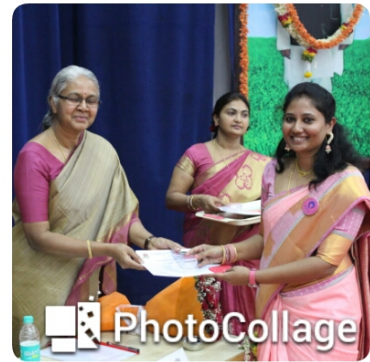
Prize distribution for the events held from 1 st march to 7 th march 2017