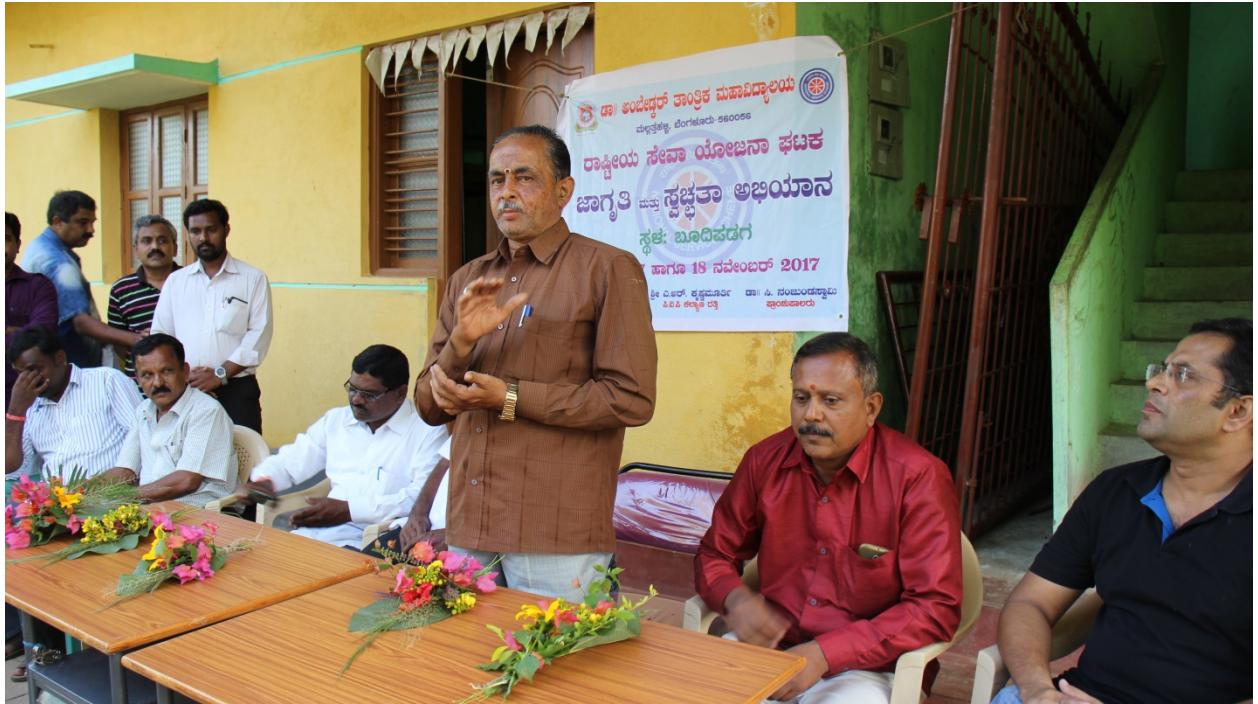
ಸಭೆಯಲ್ಲಿ ಮಾತನಾಡುತ್ತಿರುವ ಸಚಿವರು.