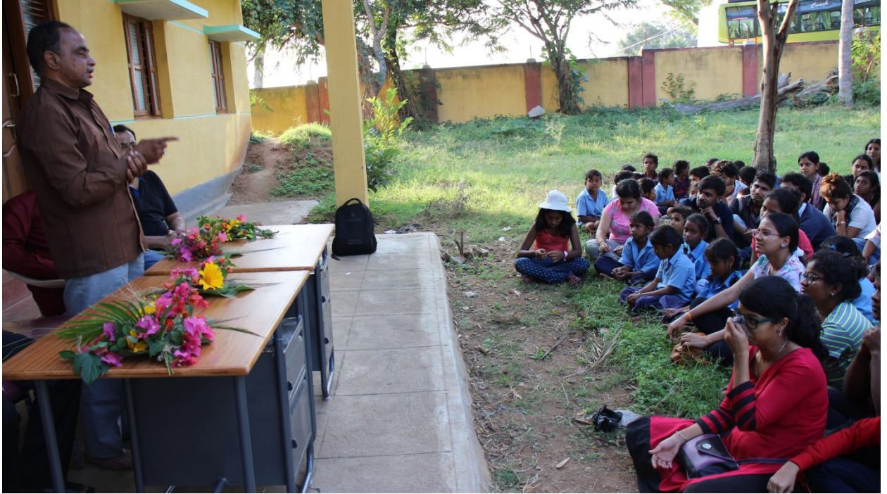
ಪ್ರತಿಭಾನ್ವಿತರನ್ನು ಸಂಪರ್ಕಿಸುವ ಕಾರ್ಯಕ್ರಮ