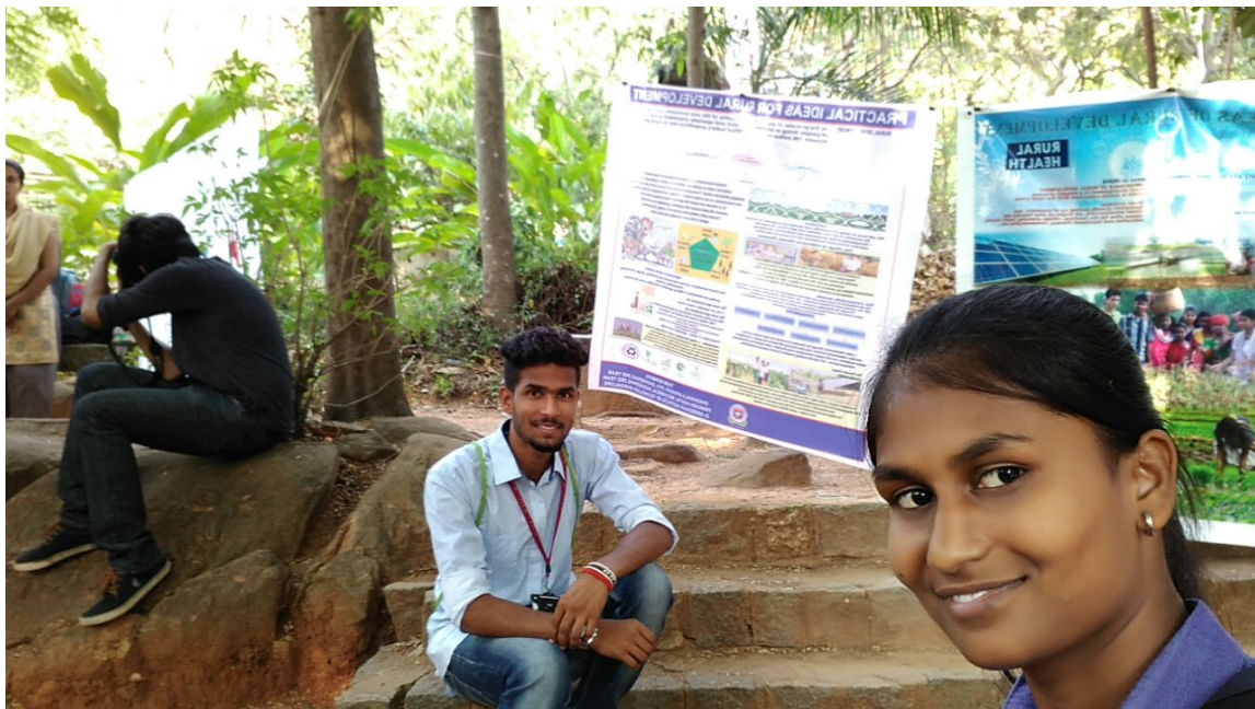
(Debate and Poster Presentation)