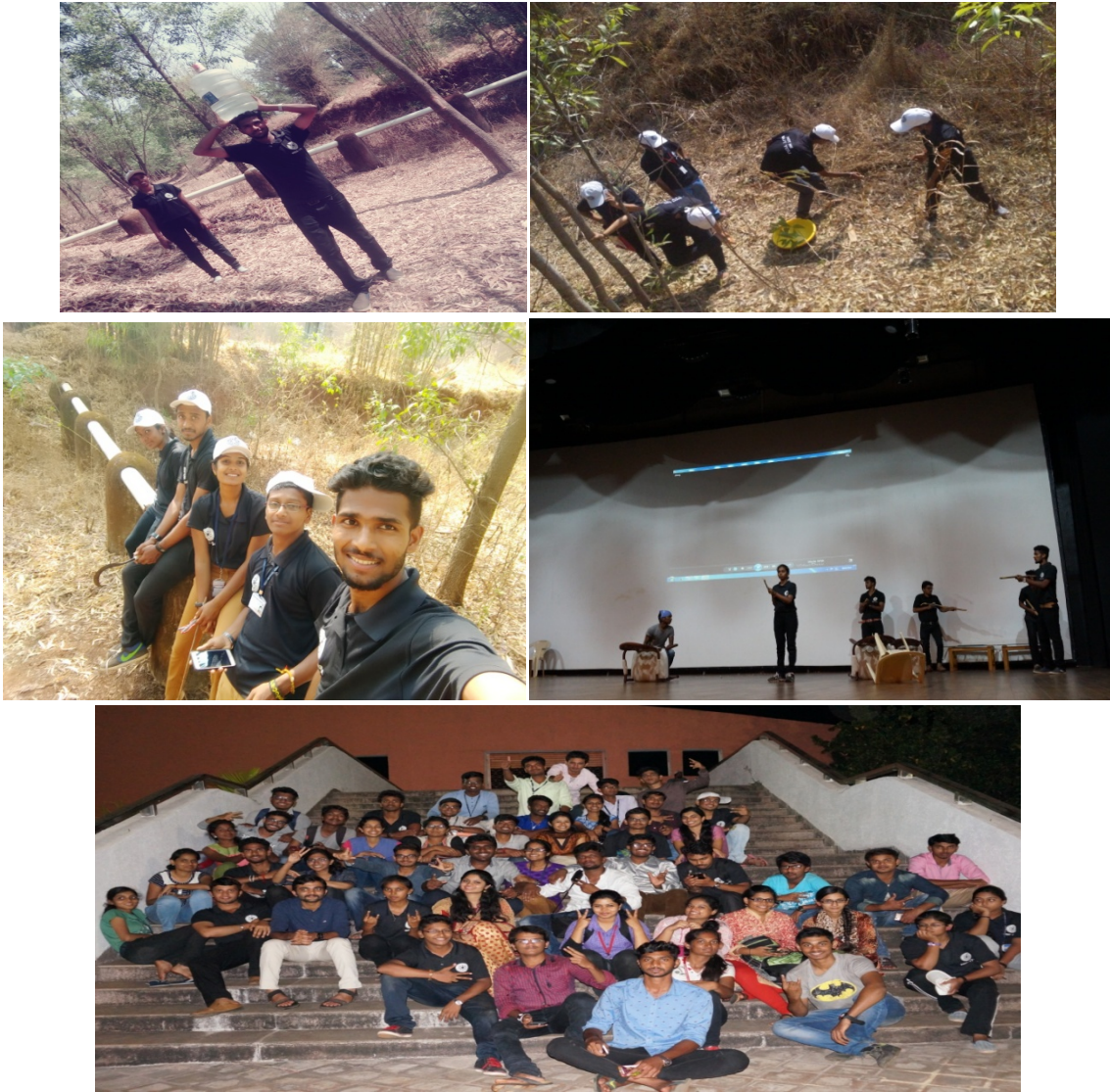
(Kenal cleaning and Soldier Skit-Team 2)