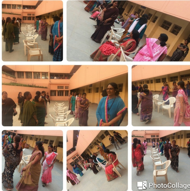
Musical Chair competition held on 01-03-2017