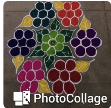
Rangoli Competition held on 07-03-2017