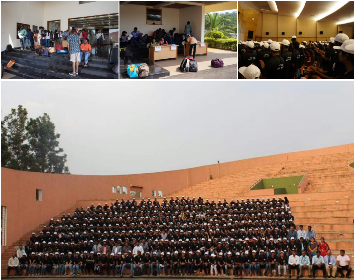
(Registration and T shirts Distribution)